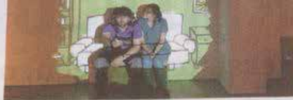
▲ De illustraties van Willemijn Schellekens worden op de muur geprojecteerd.